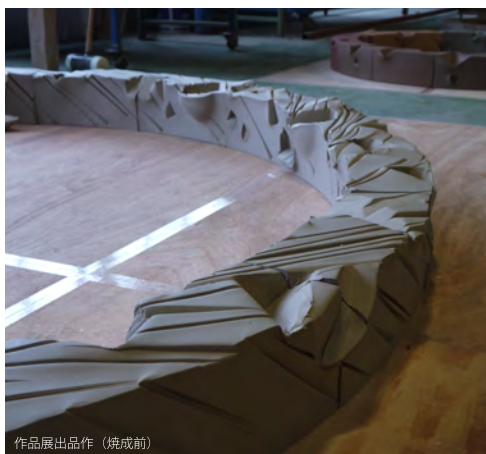
作品展出品作（焼成前）